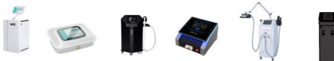
Rysunek 2. Wybrane produkty CM International S.A. przeznaczone do sprzedaży (od lewej urządzenie wielofunkcyjne M3, drenaż limfatyczny, Nuximia, Nexus, Titans, Procyon)