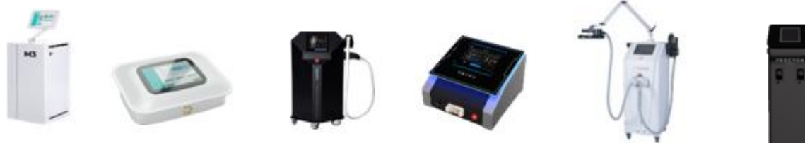
Rysunek 2. Wybrane produkty CM International S.A. przeznaczone do sprzedaży (od lewej urządzenie wielofunkcyjne M3, drenaż limfatyczny, Nuximia, Nexus, Titans, Procyon)